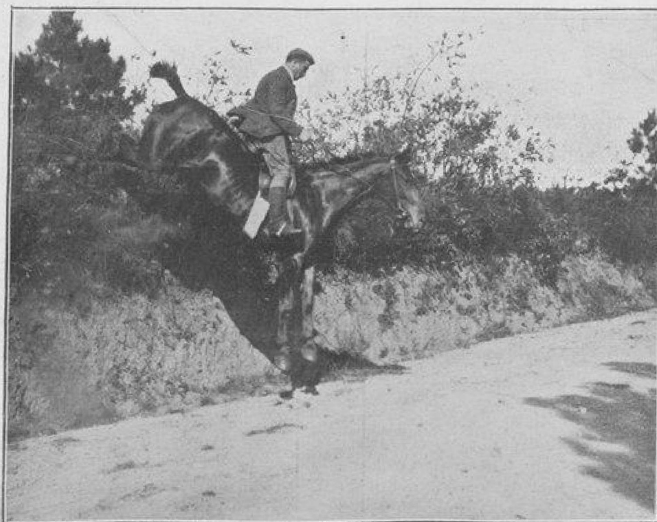
DESCENTE D'UN TALUS DE ROUTE

La meute est composée de chiens anglais et anglo-poitevins. Les chiens anglo-poitevins, tout en ayant un bon train, assurent à la chasse un joyeux concert. Ils sont en effet admirablement gorgés et dans un pays aussi accidenté que sont les environs de Biarritz, on a besoin de chiens à voix claire et retentissante en même