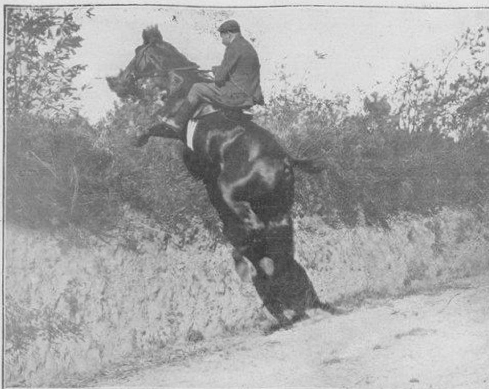
A L'ASSAUT D'UN TALUS

Les chevaux qui suivent sont des bêtes exceptionnelles ; sauteurs remarquables, ils sont d'une adresse rare, ne craignent rien, osent tout, passent n'importe où. Ils joignent à ces qualités une endurance toute particulière. Bon nombre de veneurs louent leurs chevaux. Il existe à Biarritz un manège — le manège Garderès — où l'on trouve des animaux extraordinaires, qui grâce à un dressage des plus complets, à une sélection