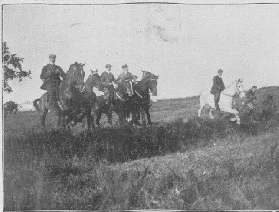
UNE CHASSE AU RENARD

Quoique le nombre des renards soit considérable dans les environs de Biarritz et quoique l'on soit sûr d'une attaque très prompte, on ne chasse jamais que des renards de sac. Les animaux du pays, connaissant à fond le terrain où ils vivent, auraient trop vite fait de prendre un parti... celui de se terrer. Alors adieu la chasse : tout serait à recommencer. En lâchant le renard, on a l'avantage d'avoir à poursuivre un animal