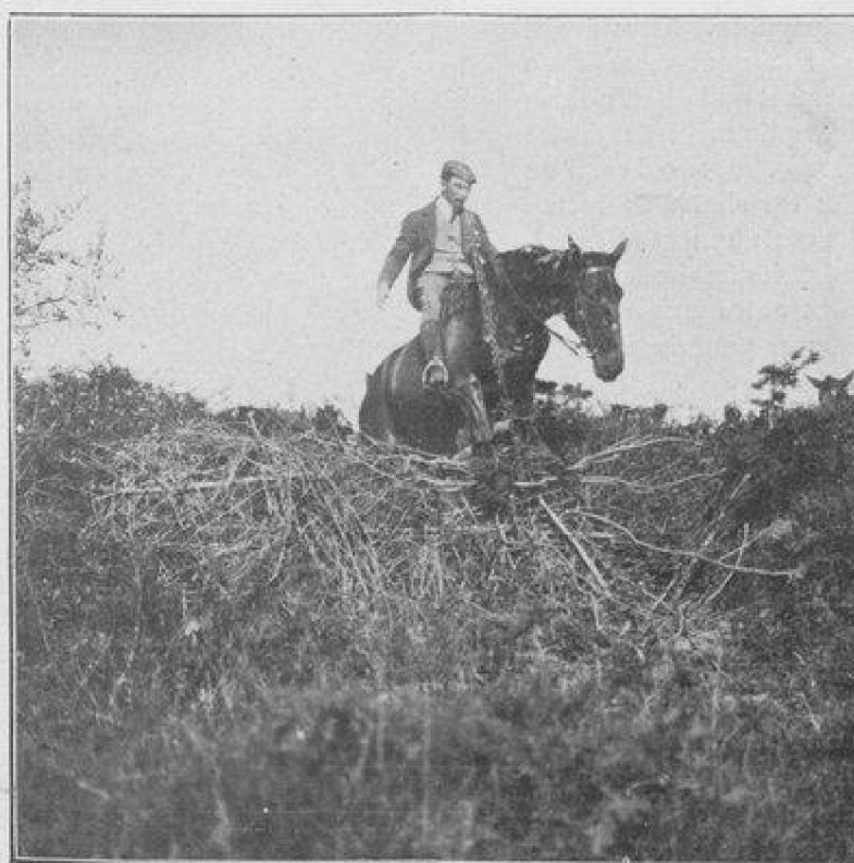
Châtes du baron Gotta